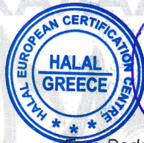
Esra Dede CEO

Το εφαρμοζόμενο σύστημα διαχείρισης ποιότητας Halal συμμορφώνεται με το OIC/SMIIC 1: 2019